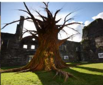
L'Arbre à vœux de Trevor Leat