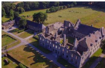
Vue aérienne de l'Abbaye de Bon-Repos , propriété départementale des Côtes d'Armor