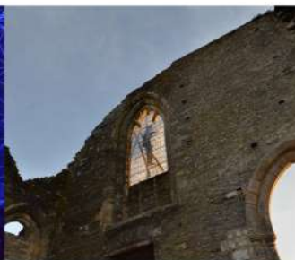
Echelle des gris de Marc Didou, propriété départementale des Côtes d'Armor

Accessible depuis le 11 mai, le domaine départemental de Bon-Repos accueille les promeneurs et sportifs qui profitent de la vue et du calme auquel invite la vallée du Blavet.