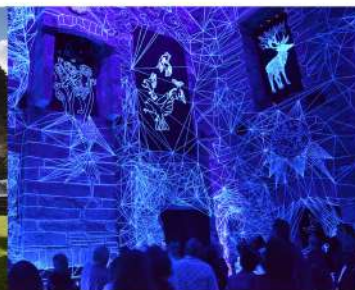
Rêves Stellaires de Julien Salaud